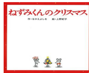
『ねずみくんのクリスマス』