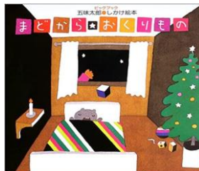
『まどからおくりもの』